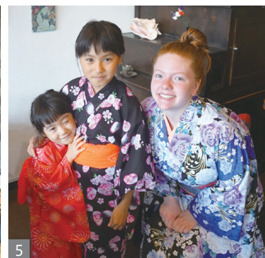
1 2 派遣生とホストファミリー 3 いわきにて 4 5 マニトバ学生とホストファミリー