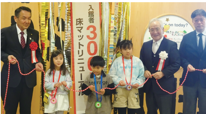
入館300万人達成セレモニー